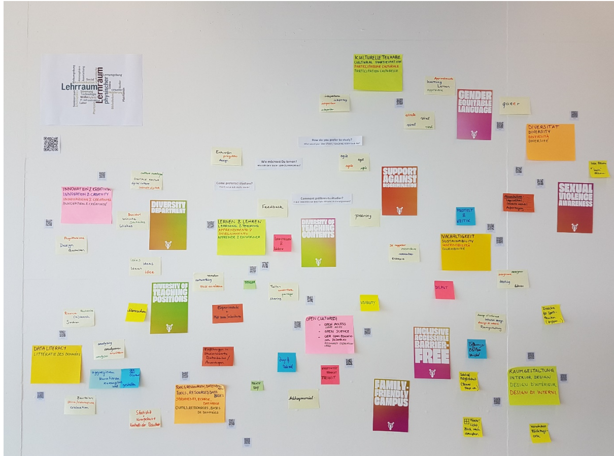
Abb. 1: Wand der Ideenbörse in der Mediathek. Copyright: CC-0

Die folgend abgebildete Wandgestaltung ist ein (Zwischen-)Ergebnis der Erhebung der Mediathek HGK FHNW anlässlich der Ideenbörse zu Lehr- und Lernräumen der Zukunft. Sie wurde zwischen dem 17.06. und 5.07.2019 erhoben. Beteiligt waren neben dem Team der Mediathek Studierende, Mitarbeitende und Dozierende.