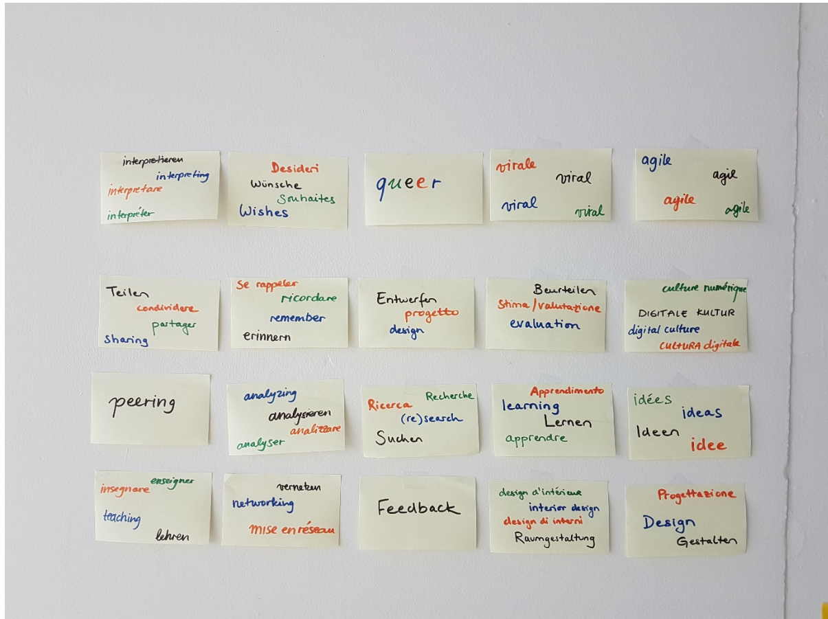
Abb. 3: Viersprachige Begriffsauswahl.